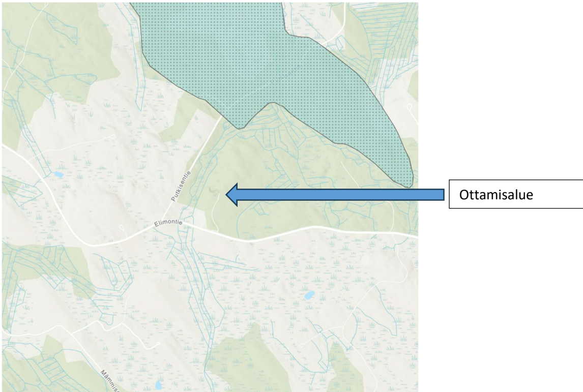
Pohjois-Karjalan maakuntakaava 2040.

Ottamisalue ja sen lähialueet ovat haja-asutusaluetta, joka on pääosin metsätalousaluetta. Alueella ei ole kaavavarauksia.