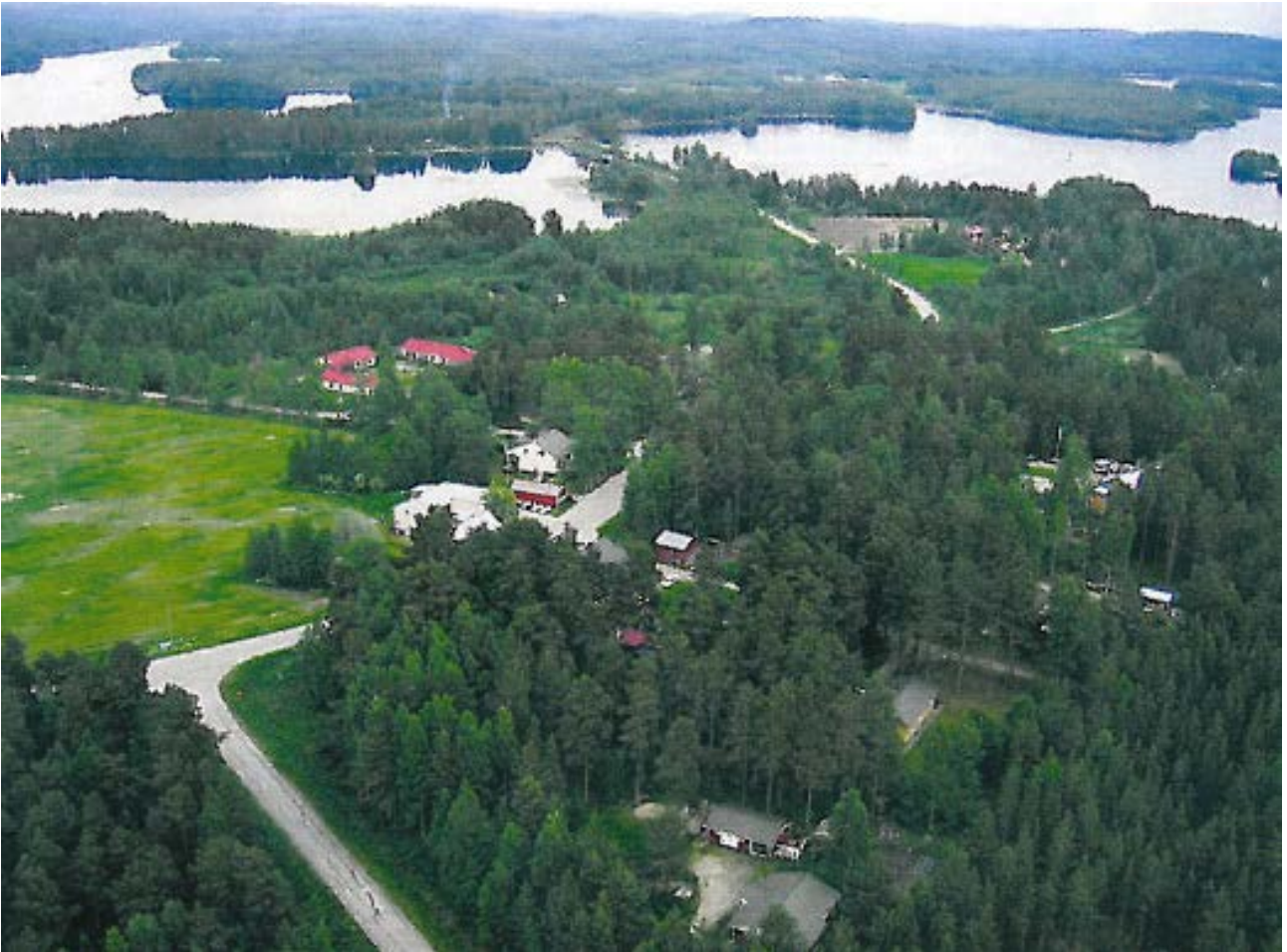
Kuva 1: Viistokuva Vuonislahdesta

OSALLISTUMIS- JA ARVIONTISUUNNITELMA 27.8.2010, tarkistettu 12.10.2017