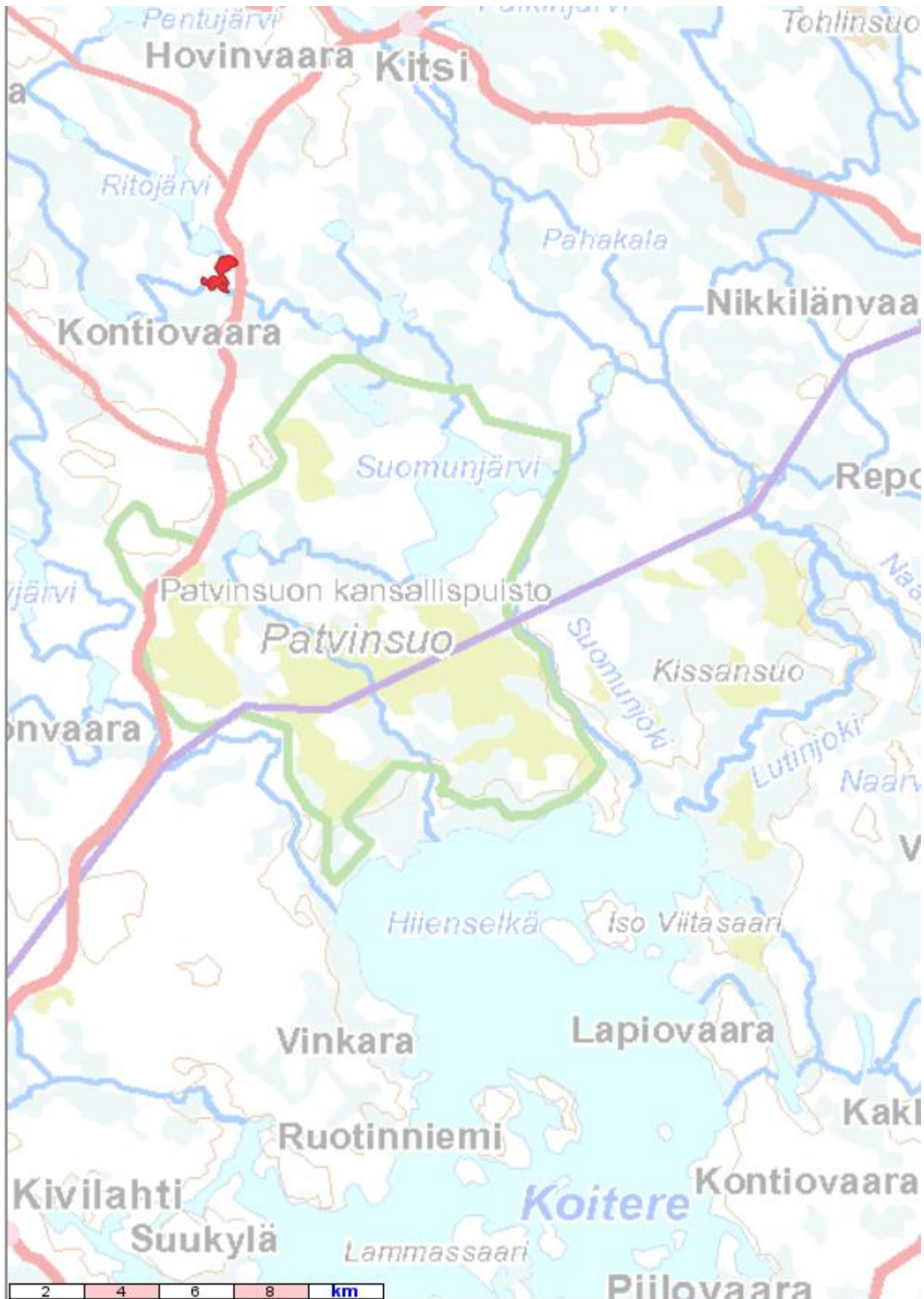
Lähestymiskartta Musta Mäntyjärvi Lieksa.