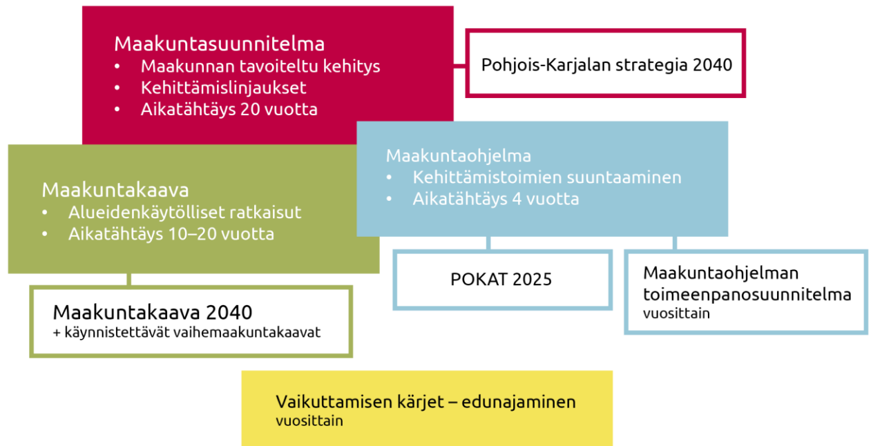
Kuva 2. Maakunnan suunnittelujärjestelmä.