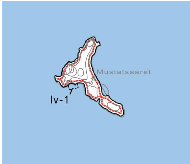
Hyväksyntä, Mustatsaaret poistettu kaavasta